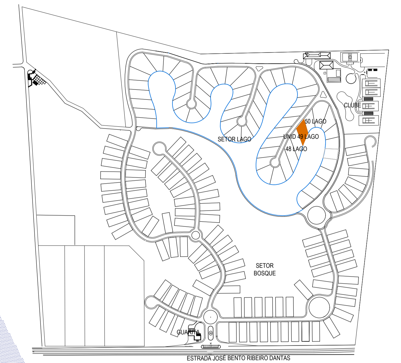
PLANTA DE SITUAÇÃO JARDIM DO LAGO ESC. SEM ESCALA